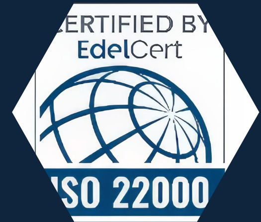
ISO 9001-14001- 45001-22000